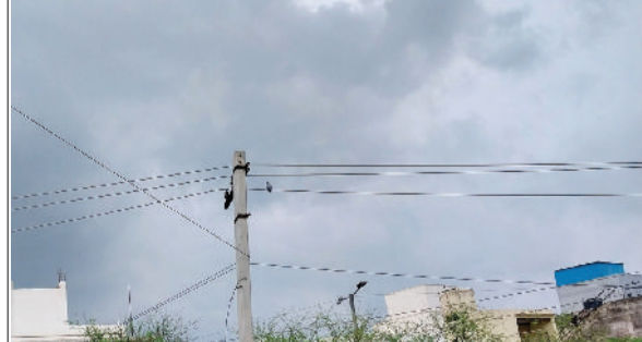
रेवाड़ी। मंगलवार दोपहर बाद छाप बरसात के बाद।

अप्रैल के पहले पखवाड़े में बदले हुए मौसम के कारण कूल-कूल अहसास का लुप्त उठा चुके लोगों को अब भारी गर्मी का सामना करने के लिए तैयार रहना होगा। बारिश का सिलसिला रुकने के बाद रात का तापमान अभी भी सामान्य से कम बना हुआ है, लेकिन दिन के समय