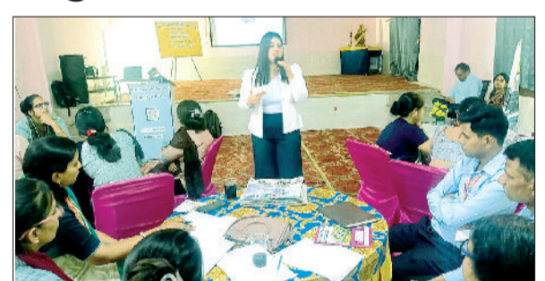
महेंद्रगढ़। कार्यशाला में भाग लेते शिक्षक।

बीआर आदर्श विद्यालय सेहलंग में शिक्षकों के लिए ज्ञानवर्धक सीबीएसई आंतरिक प्रशिक्षण कार्यशाला आयोजित की गई, जिसमें विद्यालय की दोनों प्रांच सेहलंग तथा बिरही कला के समस्त शिक्षकों ने उत्साहपूर्वक भाग लिया। यह कार्यशाला शिक्षकों के कौशल विकास एवं शिक्षण गुणवत्ता को और अधिक सुदृढ़ करने के उद्देश्य से आयोजित की गई। कार्यक्रम की शुरुआत मां सरस्वती के समक्ष दीप प्रज्वलन के साथ हुई, जिससे पूरे