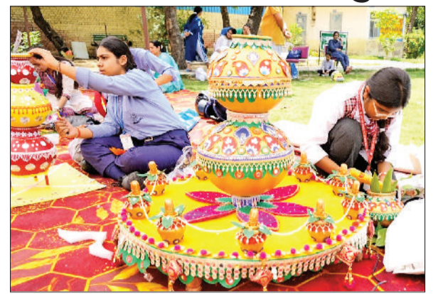
रेवाड़ी। बाल महोत्सव की प्रतियोगिता में कलश सजाती छात्राएं।