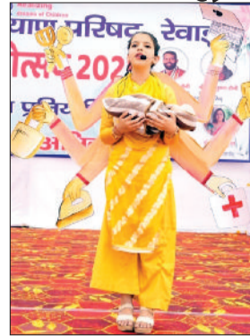
रेवाड़ी। बाल महोत्सव की फैसी ड्रेस प्रतियोगिता में भाग लेती छात्रा।