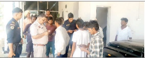
रेवाड़ी। लोगों के पहचान पत्रों की जांच करती पुलिस।