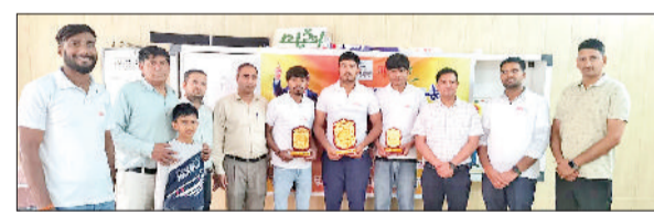
रेवाड़ी। कार्यक्रम में विजेताओं को सम्मानित करते हुए।