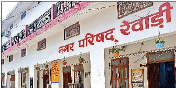
रेवाड़ी। नगर परिषद कार्यालय।

कई संभावित प्रत्याशी 'जनता की टिकट' पर भी चुनाव मैदान में भाग्य आजमाने की तैयारी में हैं। टिकट को सबसे बड़ा घमासान भाजपा में देखने को मिल सकता है। चेयरमैन पद के लिए पार्टी में चुनाव लड़ने की इच्छुक दावेदारों की लंबी फेहरिस्त है। चेयरमैन का पद एससी महिला के लिए आरक्षित होने के कारण पार्टी के अनुसूचित जाति से जुड़े पुरुष कार्यकर्ताओं और जूनियर नेताओं