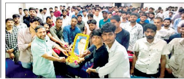
महेंद्रगढ़। जीनियस एकेडमी में भारत रत्न डॉ. भीमराव अंबेडकर जयंती मनाई गई।