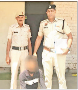
रेवाड़ी। पुलिस गिरफ्तार में आरोपी।