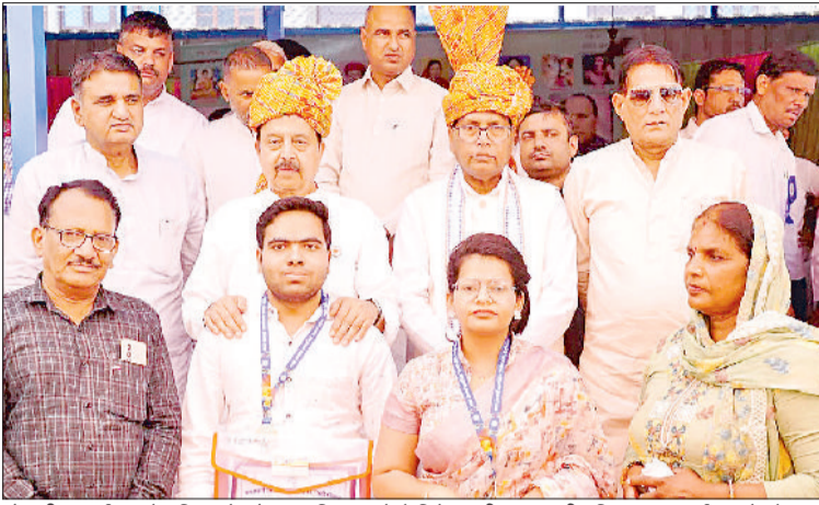
रेवाड़ी। कार्यक्रम में प्रतिभाओं को सम्मानित करते कैबिनेट मंत्री राव नरबीर सिंह तथा कार्यक्रम में मौजूद जनसमूह।