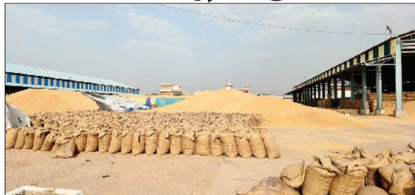
रेवाड़ी। कोसली अनाजमंडी में खुले में पड़ा लाखों क्विंटल गेहूं।

30137.7 मीट्रिक टन गेहूं की आवक और 16673.3 मीट्रिक टन गेहूं की खरीद हो चुकी है। इसके अलावा 8063.65 मीट्रिक टन गेहूं