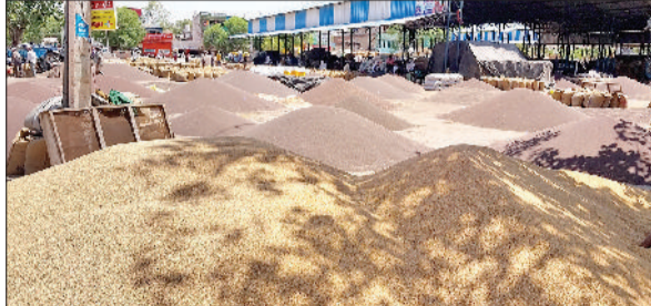
रेवाड़ी। रेवाड़ी अनाजमंडी में फड़ पर लगी गेहूं व सरसों की ढेरियां।