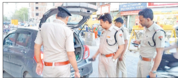
रेवाड़ी। अभियान के दौरान वाहनों की जांच करते हुए पुलिस।

जिला पुलिस की ओर से जिलेभर में सीलिंग प्लान के तहत एक विशेष चेंकिंग अभियान चलाया। अभियान का उद्देश्य क्षेत्र में अपराधिक गतिविधियों की रोकथाम, कानून व्यवस्था बनाए रखना और यातायात नियमों की पालन सुनिश्चित करना था। इस दौरान 101 वाहनों के चालान काटे गए और 3 वाहनों को इंपाउंड भी किया गया। पुलिस टीमों ने विभिन्न नाकों पर बैरिकेडिंग करके वाहनों की जांच की। दोपहिया व चार पहिया वाहनों के कागजातों में ड्राइविंग लाइसेंस, रजिस्ट्रेशन सर्टिफिकेट और बीमा की जांच की गई। साथ ही वाहनों की तलाशी भी